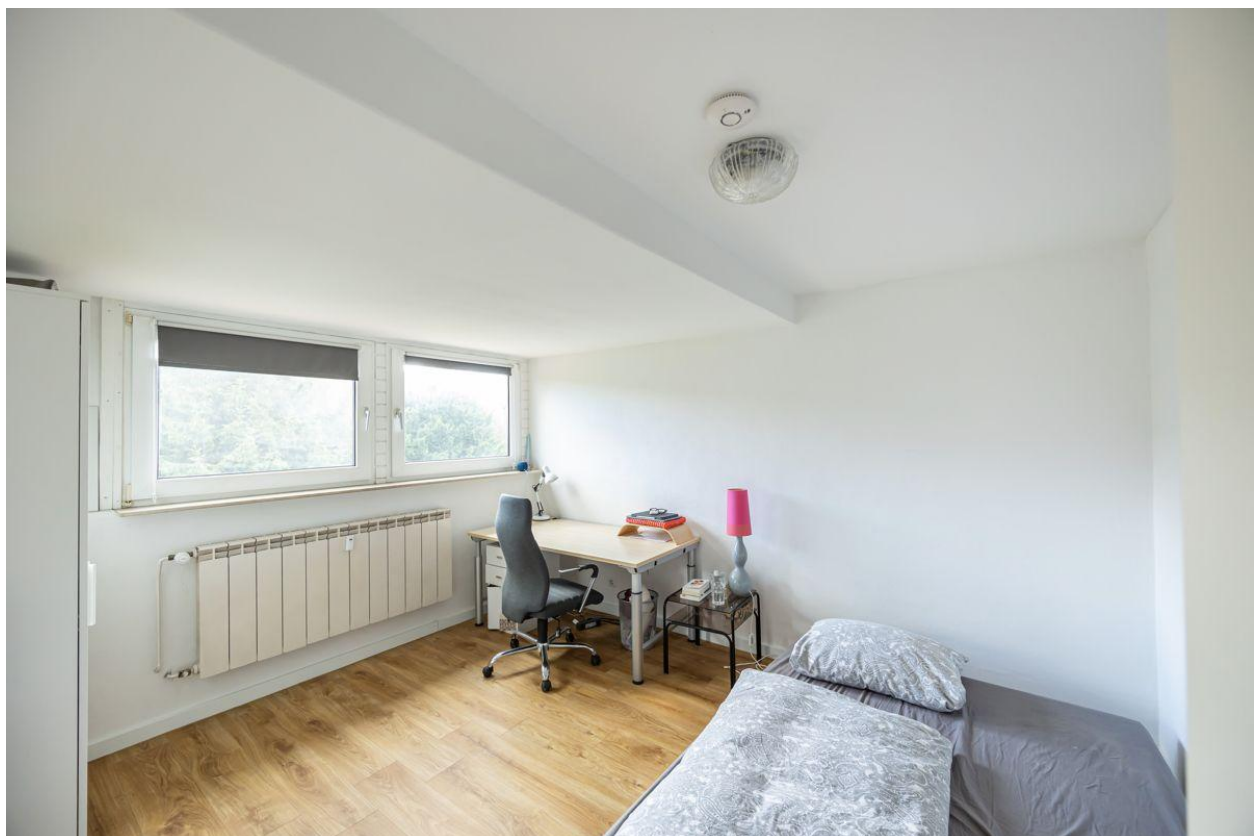
Das Gäste- und Arbeitszimmer...