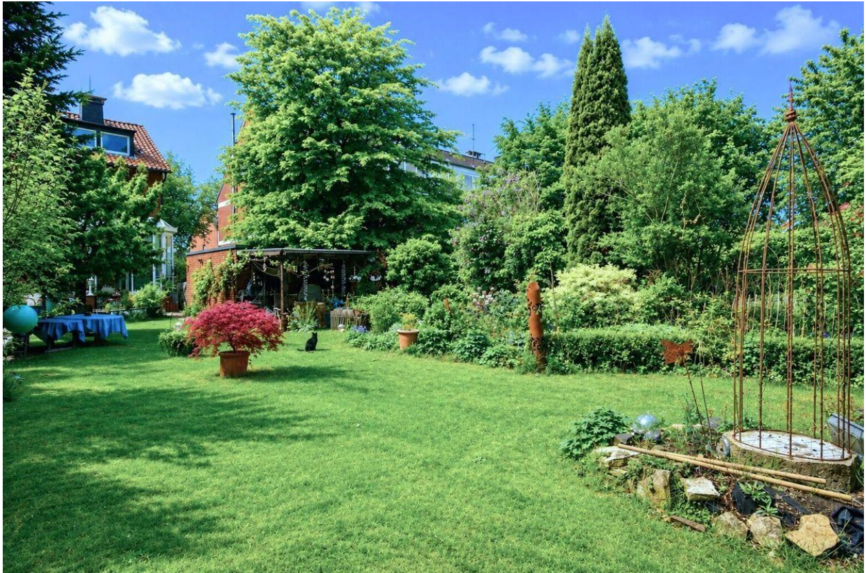
...zum wunderschönen Garten...