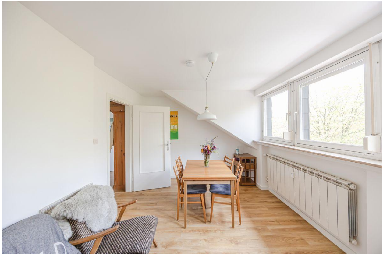
Das geräumige Wohnzimmer...