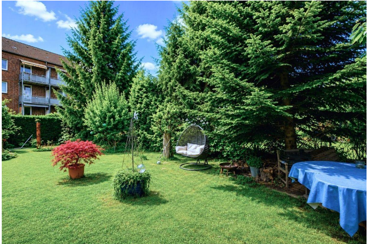
...und viel Platz zum Relaxen und Spielen