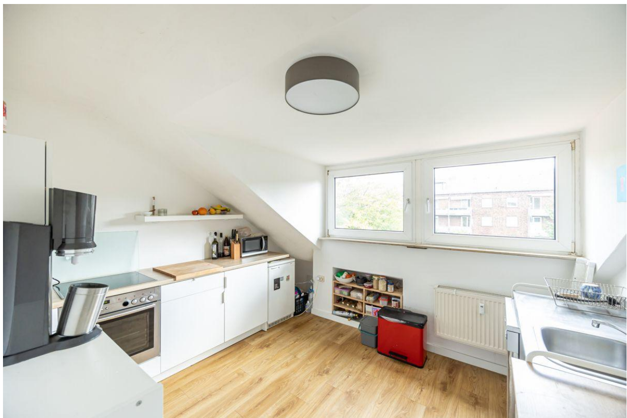
Die geräumige Küche