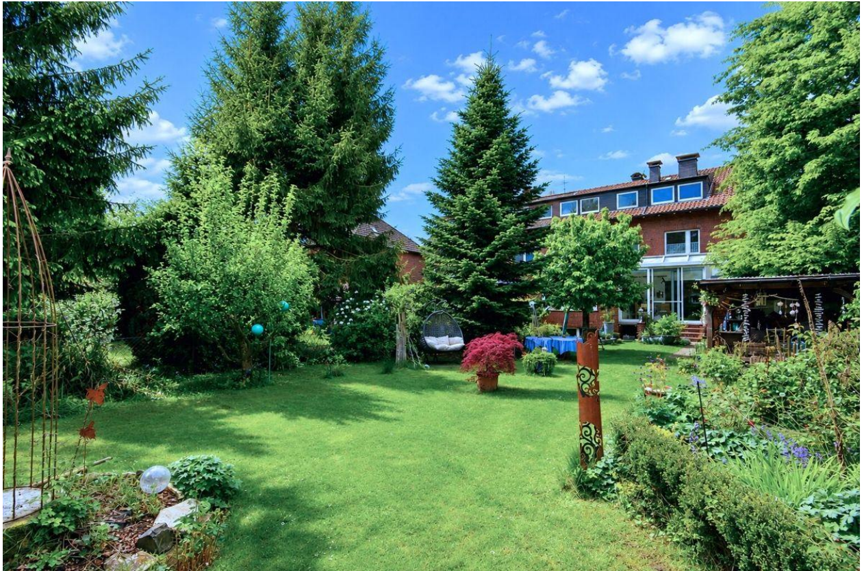
Das schöne, große Gartengrundstück