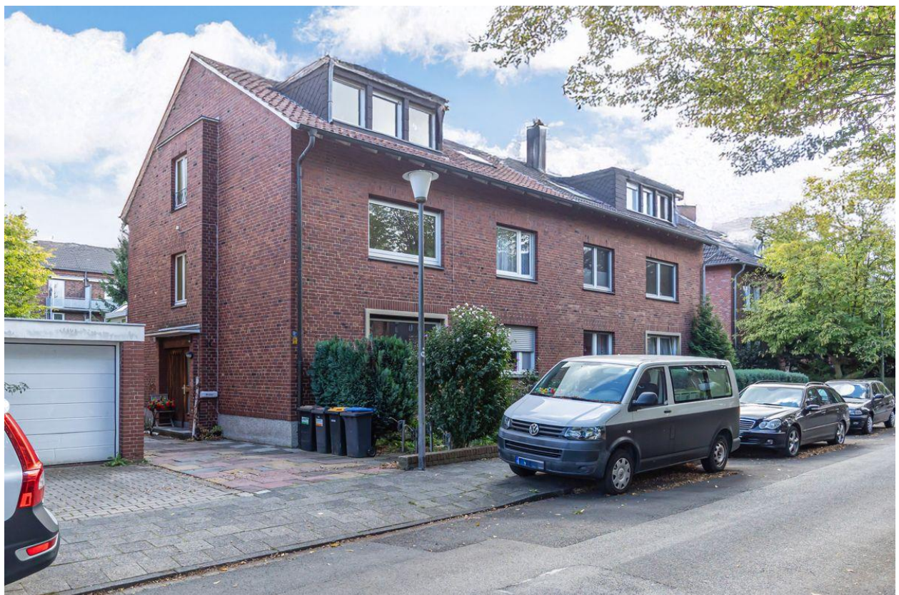
Das großzügige Wohnhaus