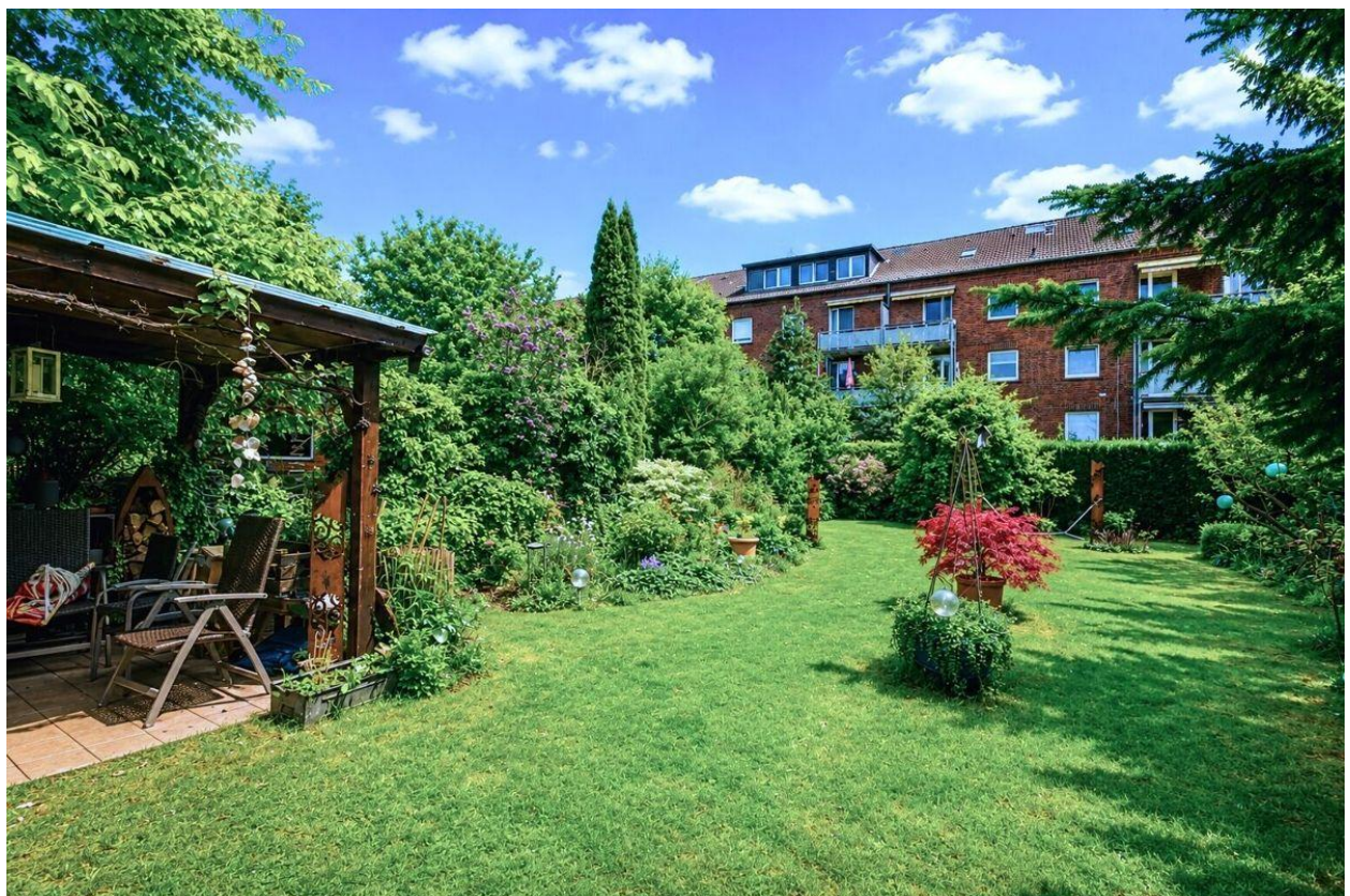
...mit schöner, eingewachsener Bepflanzung...