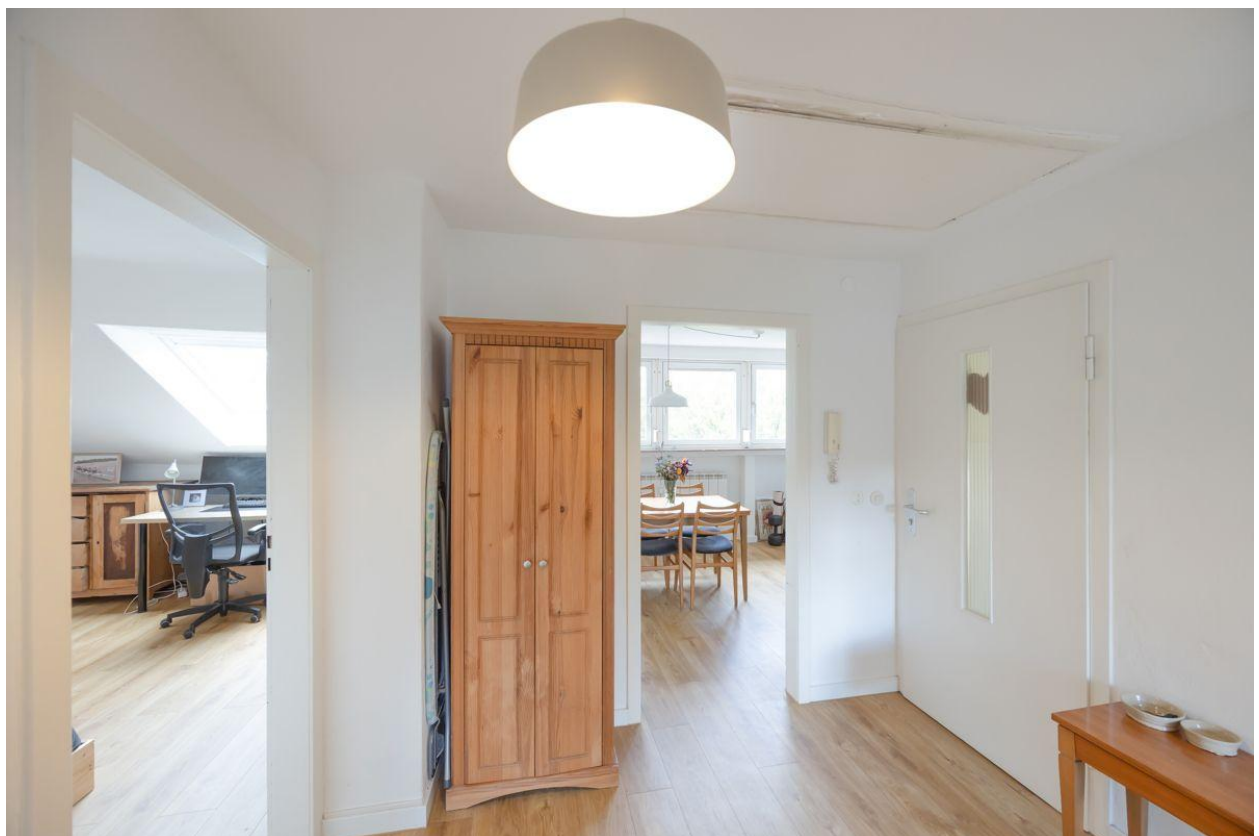
Impressionen zu einer Wohnebene...