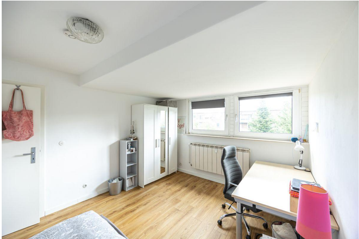
... mit viel Platz