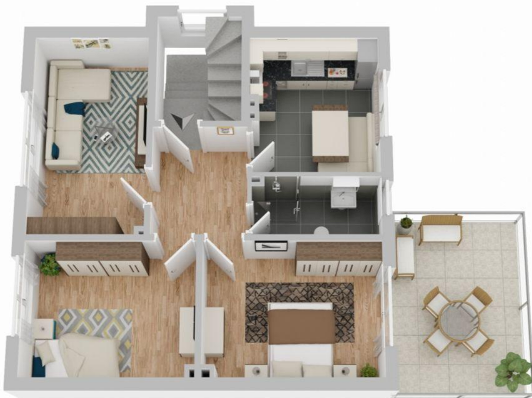
Grundriss 1. Obergeschoss